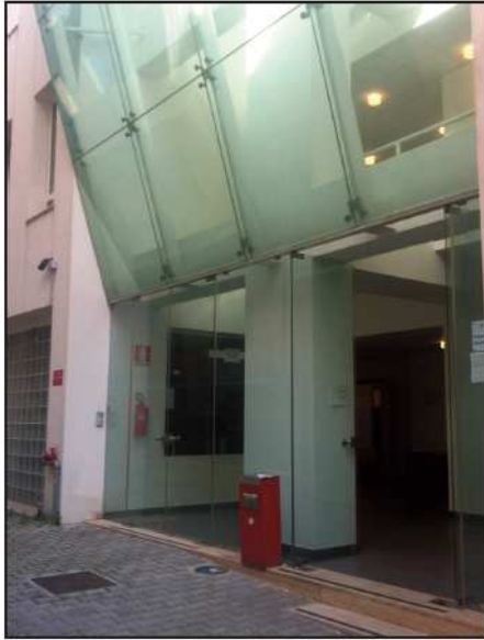
Ingresso Via Bivona