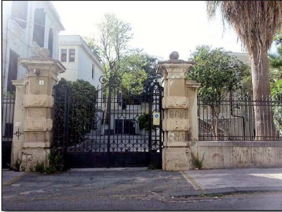
Ingresso Via Malpighi