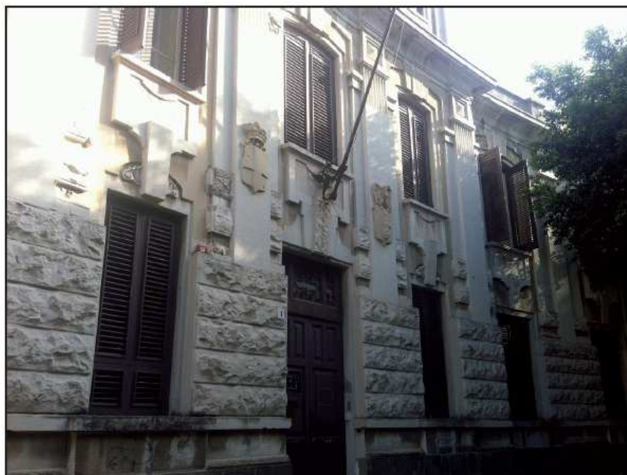
Ingresso Piazza XX Settembre

Servizio sociale, politiche sociali e studi sociologici e ricerca sociale (LM-87/LM-88)