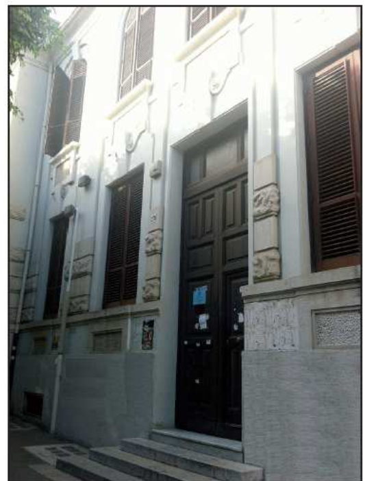
Ingresso Via Tommaso Cannizzaro, 278

L-39 Corso di Laurea in Scienze del Servizio Sociale